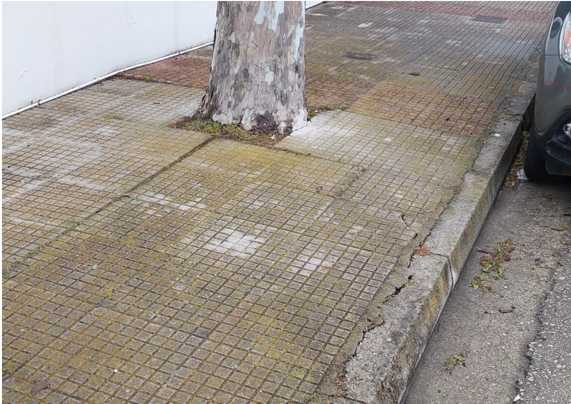
Φωτογραφία 5 Δυτικό πεζοδρόμιο οδού Βελουχιώτη -φθορές πεζοδρομίου από τις ρίζες πλατάνων