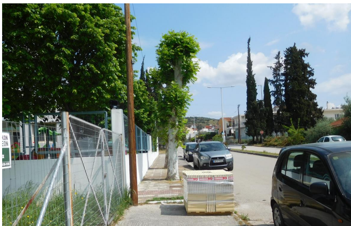
Φωτογραφία 4 Πλάτανοι -Δυτικό πεζοδρόμιο οδού Βελουχιώτη