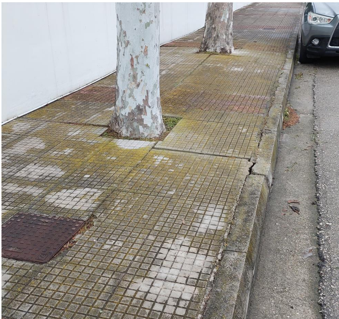
Φωτογραφία 3 Πλάτανοι -ανατολικό πεζοδρόμιο οδού Βελουχιώτη